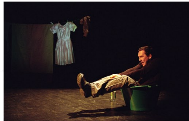
« Figir d'fami » est à l'affiche en ce mois de décembre.

« Figir d'fami », qui dresse le portrait de trois figures de son entourage à Parc-à-Mouton, continue de tourner à La Réunion dans une version à laquelle Pascal Papini a apporté son regard. On pourra le voir le vendredi 4 décembre à 20 h 30 au théâtre sous les Arbres au Port et le dimanche 20 décembre à 15 heures au Fangourin de Petite-Île dans le cadre du Boucan Créole.